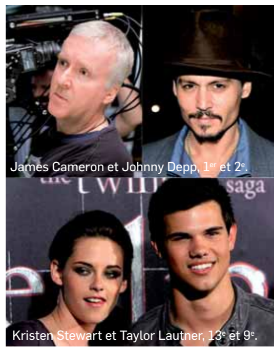
James Cameron et Johnny Depp, 1° et 2°.

Il s'agit de... James Cameron. Avec 257 millions de dollars, dont 253 millions grâce à Avatar, le réalisateur prend la tête du classement des 40 stars les mieux payées établi chaque année par le magazine Vanity Fair. Viennent ensuite Johnny Depp (100 millions), Steven Spielberg (80 millions), Christopher Nolan (71,5 millions) et Leonardo DiCaprio (62 millions). Le jeune acteur le mieux payé à Hollywood a 18 ans et s'appelle Taylor Lautner, qui incarne un gentil loup-garou dans Twilight (9°, avec 33,5 millions). La saga propulse aussi Kristen Stewart actrice la mieux payée (13°, avec 28,5 millions), devant Jennifer Aniston (18°) et Angelina Jolie (21°).