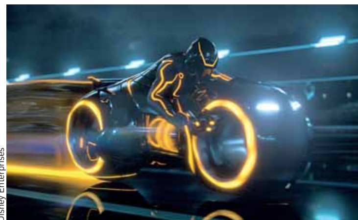
La course de moto de Tron sur la Grille virtuelle, version 2011.

LES FAITS C'est la suite d'un film mythique sorti il y a 29 ans. Tron, l'héritage , réalisé par les studios Disney, débarque demain en salles, en 3D.