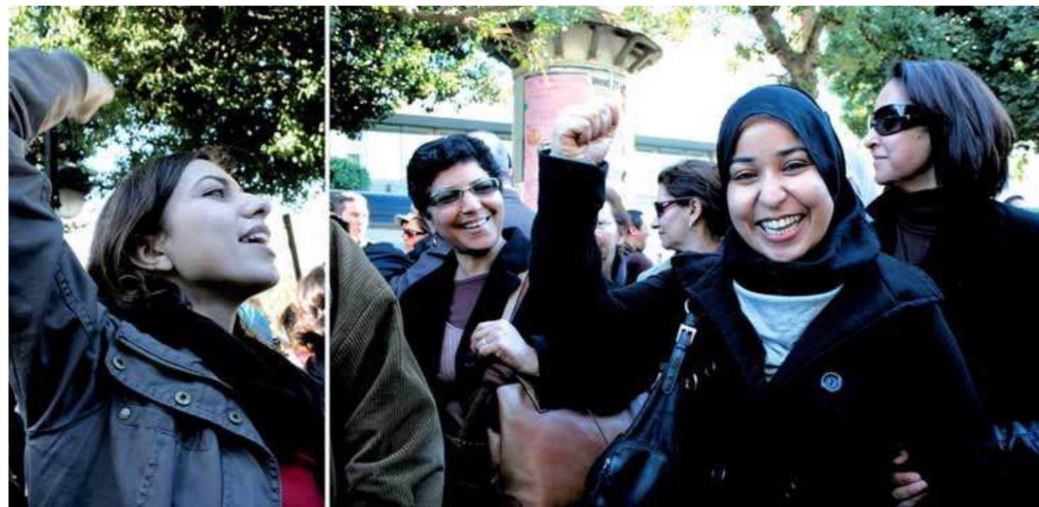
Une marche pour l'égalité, la citoyenneté et la dignité a été organisée par plusieurs associations de femmes, le 29 janvier à Tunis. Le cortège a été dispersé plusieurs fois à cause de contre-manifestants qui s'opposaient à l'égalité entre hommes et femmes.

deux ans avant la France). Mais au sein de la société, les comportements machistes demeurent.